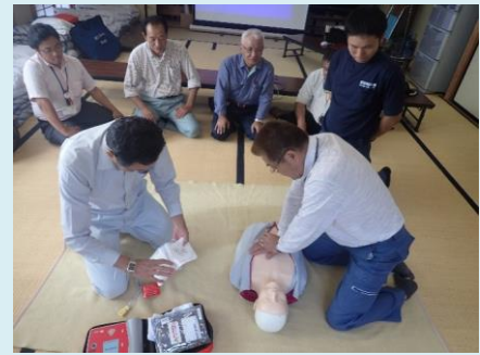
双葉町パトロール隊 普通救命講習会